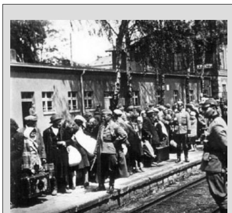
Żydzi na dworcu kolejowym w Olkuszu przed deportacją na zagładę, czerwiec 1942 r.

Siedemdziesiąt trzy lata temu, w dniach 13 i 15 czerwca 1942 r., deportowano ostatecznie Żydów z getta olkuskiego w dwóch transportach kolejowych, które pojechały w kierunku Katowic. Wywieziono wówczas około trzech tysięcy Żydów (mężczyźni, kobiety i dzieci), wśród których byli również liczni Żydzi z Chorzowa, przesiedleni do Olkusza przez niemieckich nazistów w dniu 15 czerwca 1940 r. Wprawdzie nie ma żadnej dokumentacji hitlerowskiej związanej z ich zagładą, lecz z pewnością zamordowano ich w komorach gazowych KL Auschwitz II-Birkenau.