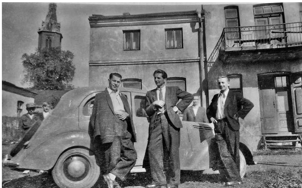
Zachodnie skrzydło Gęsiej 4 od południa, lata 50. XX w.