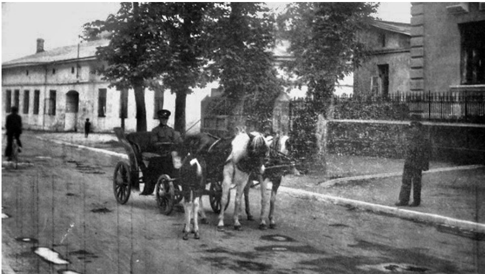
Od lewej Mickiewicza 1 (Górnica 2), niezabudowany plac Mickiewicza 3 i fragment 5 („willa Buchowieckich”)

Przedwojenna ulica Mickiewicza zaczynała się od skrzyżowania z Górnica i biegła na południe w stronę kolei, zatem współczesna numeracja, a przez to i parzystość stron, jest odwrócona w stosunku do przedwojennej. Przy ulicy Mickiewicza pod numerem 2 znajdował się miejski „Ogród Spacerowy”, pod numerem 7 (tożsamym ze Sławkowską 5) Szkoła Powszechna, pod 13 znajdowała się parafia katolicka (maszynowy zapis „ruiny” został skreślony i pojawił się odręczny zapis „dom parafjalny”), pod 14 stara elektrownia miejska, pod 15 parafia katolicka Kościół, pod 16 znajdował się plac miejski, a pod 19 Kasa Chorych 773 .