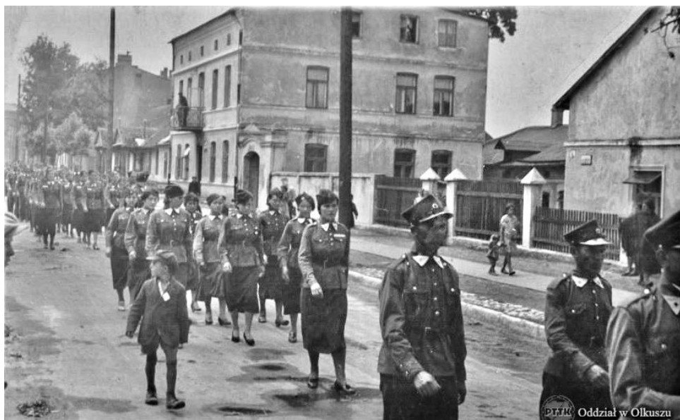
Z lewej ściana szczytowa Mickiewicza 12, parterowa zabudowa Mickiewicza 10 i 8, dwupiętrowa kamienica przy Mickiewicza 6 i fragment Mickiewicza 4