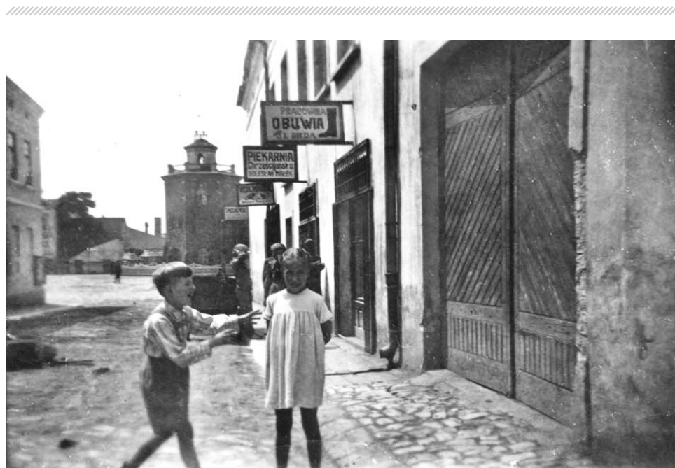
Od lewej fragment Parczewskiej 2, wylot ulicy Parczewskiej do rynku (pl. Piłsudskiego) z wieżą ciśnień, Parczewska 1, fragment Parczewskiej 3