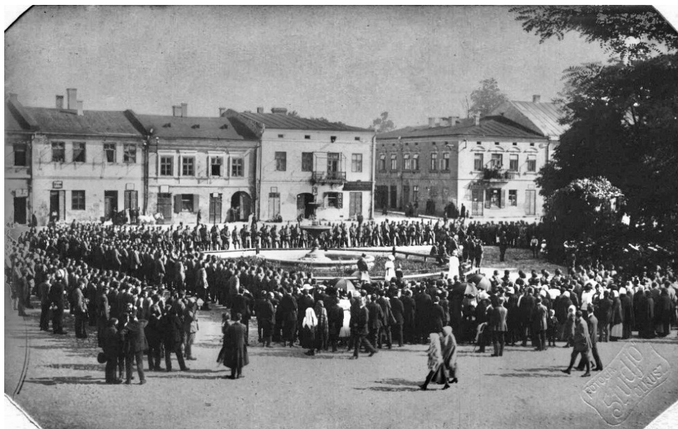
Wizyta generała Hallera, 02.09.1919 r., od lewej pl. Piłsudskiego 27 (fragment) i 26, Parczewska 1, wylot ulicy Parczewskiej do rynku, Parczewska 2, fragment pl. Piłsudskiego 25

Przedwojenna ulica Parczewska to współczesna ulica Floriańska ciągnąca się od Rynku do ulicy Górniczej. Według wykazu nieruchomości położonych w mieście Olkusz z 1935 r. pod numerem 5 znajdowały się miejskie jatki, a pod numerem 7 re-miza strażacka 803 . Mieszkała przy niej głównie ludność żydowska, a także rzymscy katolicy i jeden greko-katolik.